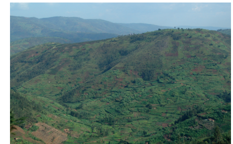
Besuch in Gakenke-Ruanda 2008

Im Herzen Afrikas gelegen beeindruckt Ruanda mit seiner grünen Hügellandschaft, seiner kulturellen Vielfalt und seinem Engagement für Bildung und Fortschritt.