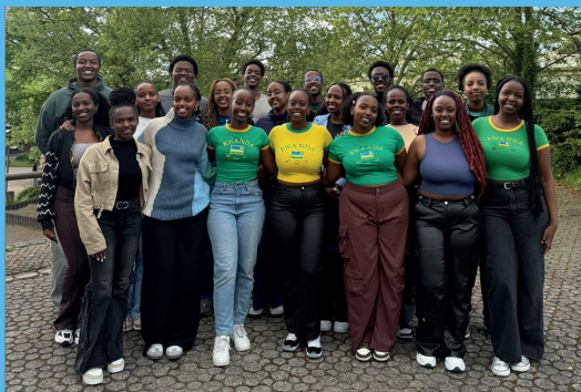
Einige der derzeitigen Studierenden an der RPTU

Feiern Sie mit uns dieses besondere Jubiläum und werden Sie Teil der gemeinsamen Geschichte zwischen der RPTU und Ruanda. Wir freuen uns auf Ihr Kommen!