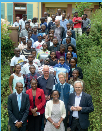
Sommerfest 2015, Villa Denis