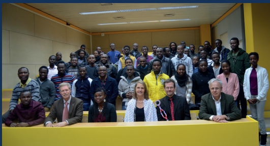
Studenten im Hörsaal 09.11.2016