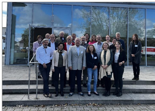
Die Regionalkonferenzen waren gut besucht und regten, wie hier in Herxheim, zum Austausch an

Im Rahmen des Jubiläumsjahrs, sollte es auch für die engagierten Partnerinnen und Partner in Rheinland-Pfalz die Möglichkeit geben, in den Austausch zu kommen und über Probleme und Chancen der Partnerschaft im vierzigsten Jahr zu beraten. Hierzu fanden vier Regionalkonferenzen in Vallendar, Trier, Kaiserslautern und Herxheim statt. Bei den jeweils eintägigen Veranstaltungen wurde vor allem über die Zukunft der Partnerschaft gesprochen.