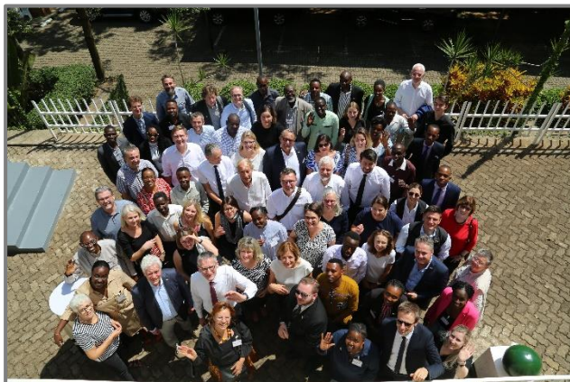
Im Rahmen der Delegation besuchten die Teilnehmenden auch das Koordinationsbüro

Im Oktober 2022 wurden die Feierlichkeiten dann nach Ruanda verlagert. Unter Leitung von Ministerpräsidentin Malu Dreyer und Landtagspräsident Hendrik Hering reiste eine Delegation in das Partnerland. Während der einwöchigen Delegation fanden diverse wertschätzende Empfänge der ruandischen Partnerinnen und Partner, der Ministerien und der deutschen Botschaft statt. Gemeinsame Projektbesuche verdeutlichten erneut, wie vielseitig und lebendig die Partnerschaft auch im 40. Jahr ist. Durch diese Delegationsreise konnten neue Kontakte geknüpft und bereits bestehende weiter intensiviert werden.