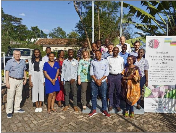
Der geschäftsführende Vorstand gemeinsam mit den Mitarbeitenden des Koordinationsbüros

Gelegenheit, um mit den Mitarbeitenden des Koordinationsbüros in den engen Austausch zu treten. Gemeinsam wurde die bisherige Arbeit der Partnerschaft reflektiert und über die Zukunft der Partnerschaftsarbeit diskutiert.