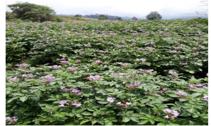
Figure 7: A farm of Tuzamurane farmer cooperative. Located in Kinigi sector