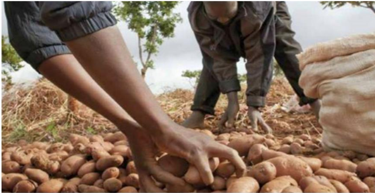
Farmers select irish potato seeds.

A kilogramme of (Irish) potato seeds has increased to Rwf700 from between Rwf400 and Rwf500 in the last farming season which ended in February 2020, according to the Federation of Irish Potato farmers' cooperatives in Rwanda.